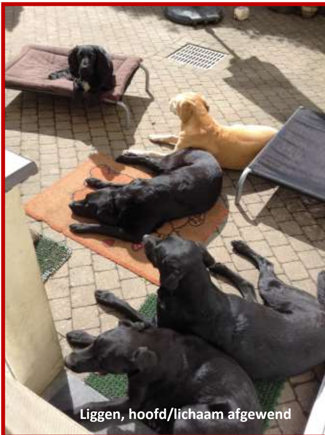
Liggen, hoofd/lichaam afgewend

Honden hebben sociaal contact nodig en voelen zich prettig in gezelschap. Kalmerende signalen is een term die voor het eerst gebruikt werd om de lichaamstaal te beschrijven, die honden gebruiken om te communiceren, conflicten te vermijden en stress te reduceren door Turid Rugaas, hondentrainer, gedragsdeskundige en schrijfster.