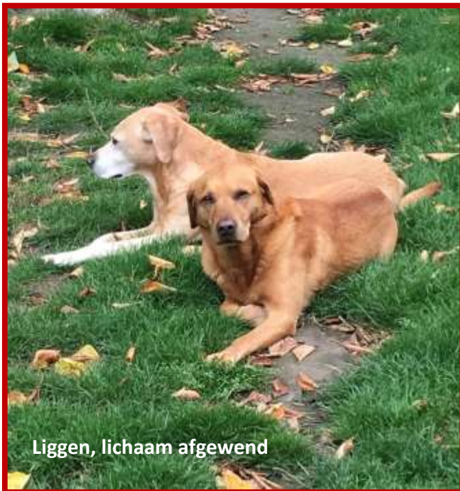
Liggen, lichaam afgewend

Waar mogelijk moeten we hen de vrijheid geven om hun eigen keuzes te maken. Waar dit onmogelijk is moeten wij ze helpen de juiste keuzes te maken.